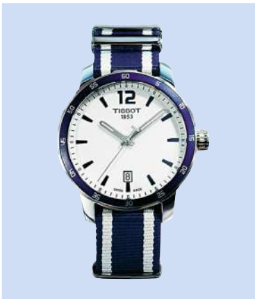
Tissot «Quickster Nato»: 40 mm, Schweizer Quarzwerk mit Batterie-Endanzeige, Datum bei sechs Uhr, Stunden- und Minutenzeiger mit Superluminova, Lünette mit eingelassenem Aluminiumring, kratzfestes Saphirglas, wasserdicht bis 100 m, Gehäuse aus Edelstahl, Nato-Armband, 325 Fr.; www.tissot.ch