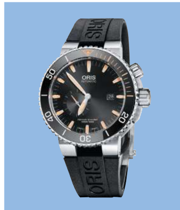
Oris «Carlos Coste Limited Edition IV»: 46 mm, Manufaktur-Kaliber mit Selbstaufzug, Datum, kleine Sekunde, einseitig drehbare Keramik-Lünette, verschraubte Edelstahl-Krone, limitiert auf 2000 Stück, mit Kautschukarmband: 2500 Fr., Version Titanarmband: 2800 Fr.; www.oris.ch