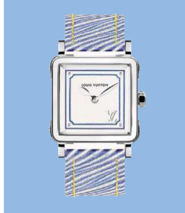
Louis Vuitton «Emprise Epi Denim»: 23×23 mm, ETA-Präzisionsquarzwirk, Stunden, Minuten, silberfarbenes, opaleszentes Zifferblatt mit Louis-Vuitton-Signatur, entspiegeltes Saphirglas, wasserdicht bis 50 m, Edelstahlgehäuse, Armband aus Epi in Light Denim, 2770 Fr.; www.louisvuitton.com

Und während der Kapitänsanwärter funktionaler tickt, gibt sich die Dame lieber der Schönheit des Augenblicks hin – seefest sind diese Uhren alle