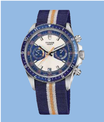
Tudor «Heritage Chrono Blue»: 42 mm Durchmesser, Chronograf mit Selbstaufzug, Zeiger und Stundenindizes mit Superluminova, kleine Sekunde, 45-Minuten-Zähler, beidseitig drehbare Lünette, Krone und Drücker verschraubbar, Nato- und Edelstahlarmband, 4200 Fr.; www.tudorwatch.com