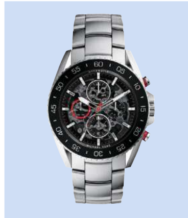
Michael Kors «MK9011 Jet Master Automatic»: 45 mm, Chronograf mit Selbstaufzug, Datum- und 24-Stunden-Anzeige, durchbrochenes Zifferblatt, einseitig drehbare Lünette, verschraubter Boden, wasserdicht bis 50 m, Gehäuse und Armband aus Edelstahl, 469 Fr.; www.michaelkors.com