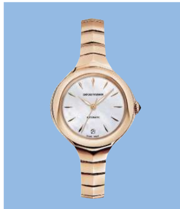
Emporio Armani «Fluid Deco Ars 8208»: 34 mm, Automatik-Kaliber, Swiss made, 3-Zeiger-Uhr mit Datum bei sechs Uhr, Zifferblatt aus Perlmutt, Gehäuse aus Edelstahl mit Roségold, poliert, 82 Diamanten, Armband mit Doppelfaltschnelle, limitiert auf 88 Stück, 2150 Fr.; www.armani.com