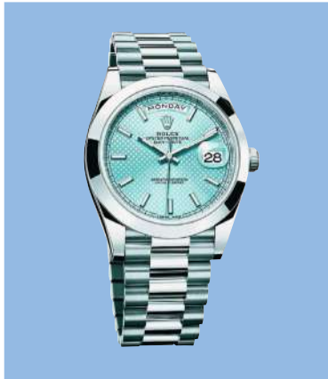
Rolex «Oyster Perpetual Day-Date 40»: 40 mm, neues, COSC-zertifiziertes Automatikwerk 3255 mit 14 Patenten, 70 Stunden Gangreserve, Datum und Wochentag, hochleistungsfähiges Antischocksystein, Präzision: -2 bis +2 s pro Tag, Zifferblatt in «Eisblau», Platin, 54 000 Fr.; www.rolex.com