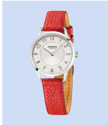
Hermès «Slim d'Hermès»: 25 mm, Schweizer Quarzwirk (nur 2,1 mm hoch), Stunde, Minute, Zifferblatt aus versilbertem Opalin, Perlen an Stunden-Ziffern, rhodinierte, sandgestrahlte Stabzeiger, Gehäuse aus Edelstahl, Armband aus Alligatorleder mit Dornschnelle, 2600 Fr.; www.hermes.com