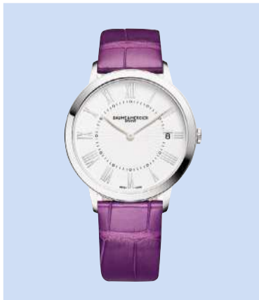
Baume & Mercier «Classima MOA 10224»: 36,5 mm, Quarzwirk, Stunde, Minute, Datum, mattweisses Zifferblatt mit Sonnenschliff, kratzfestes Saphirglas, Gehäuse aus Edelstahl, Armband aus Alligatorleder, bis zu 50 m wasserdicht, 1600 Fr.; www.baume-et-mercier.com