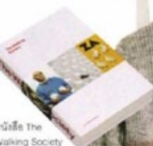
หนังสือ The Walking Society จาก Camper*