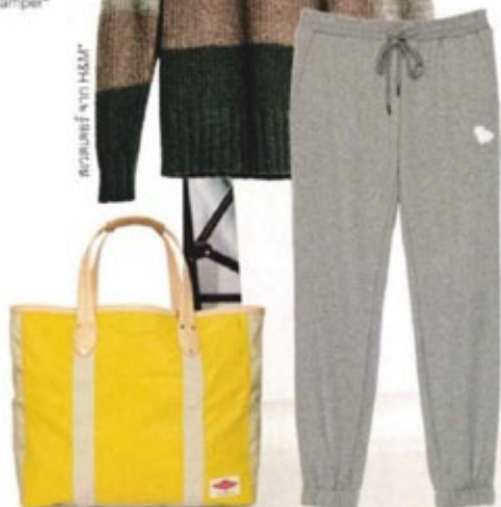
กระเป๋า จาก Rag & Bone*