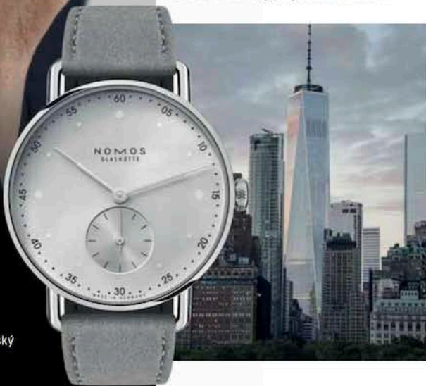
Text: Sabrina Karasová